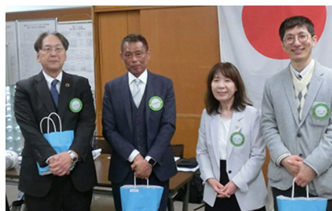
入会記念日御祝 (4月)