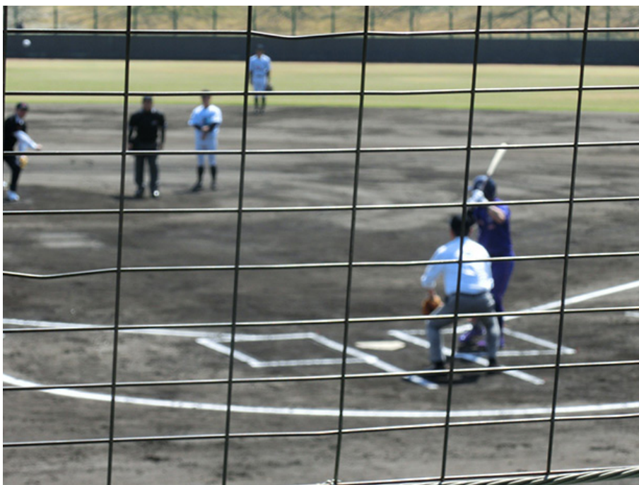
ピッチャー・都倉市長 キャッチャー・中野会員