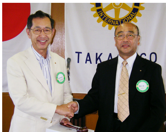
前会長記念品贈呈