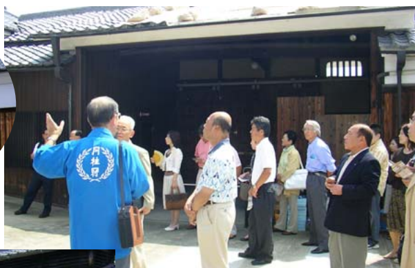
酒蔵の中を丁寧に解説していただきながら見学しました。