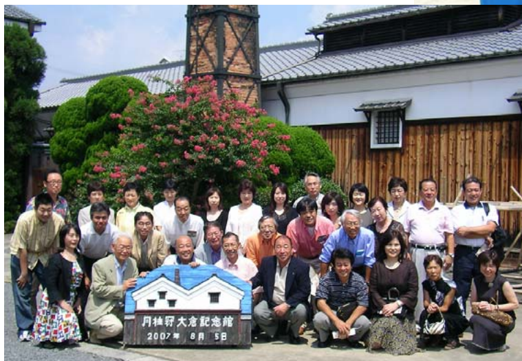
酒蔵前でみんな揃って記念写真。