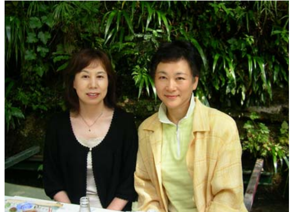
おいしいお酒に、おいしい料理。会話が弾みます。