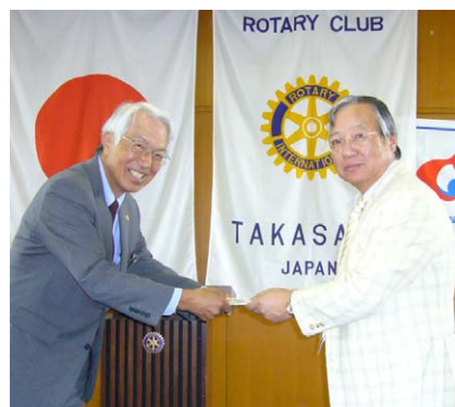
御子息結婚祝い 山名会員