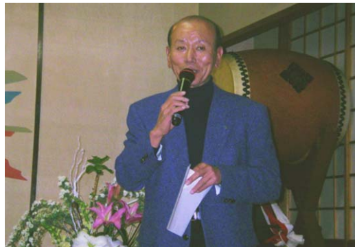
桂田親睦活動副委員長挨拶