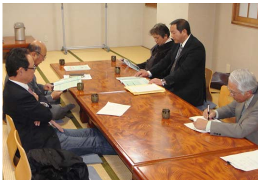
インフォメーション風景