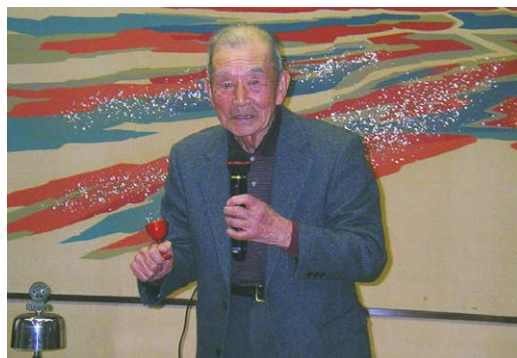
植杉会員乾杯ご発声