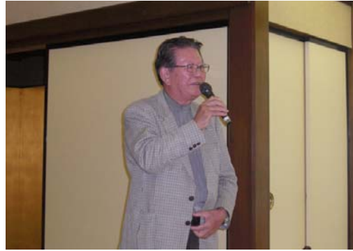
伊地知親睦活動委員長ご挨拶