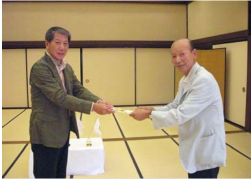
桂田会員 ご子息結婚祝い