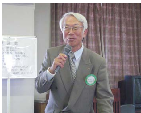
講師紹介 坂牛会員