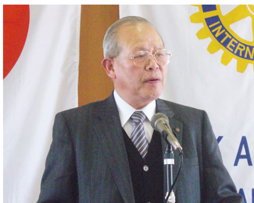
ガバナー補佐 西尾 淳様