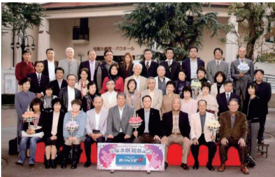
家族例会記念撮影『宝塚歌劇鑑賞』H23.11.13