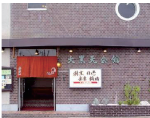
引継ぎ家族例会会場：大黒天