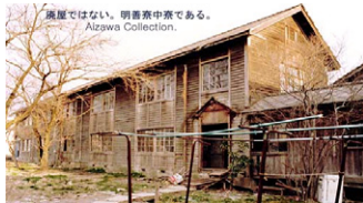
当時「火が付いたら3分間で燃え尽きる」と消防署から指摘されていた学生寮

2年間学生寮生活 麻雀ばかりの退廃的な生活 悲惨な環境だが、極めて楽しい思い出 近所の女子学生寮に突入するのが恒例行事