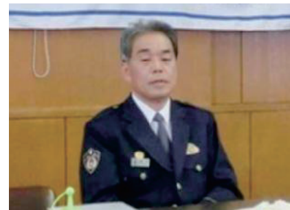
高砂警察署 神戸 弥 署長