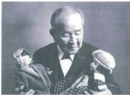
8 贈られた西洋人形を抱く渋沢栄一。 Eiichi Shibusawa with the dolls that were presented from U.S.

11 ミズーリ州セントジョセフ博物館に贈られた「ミス兵庫」。身長 82 センチ。人形は各州に 1 体ずつ配られた。