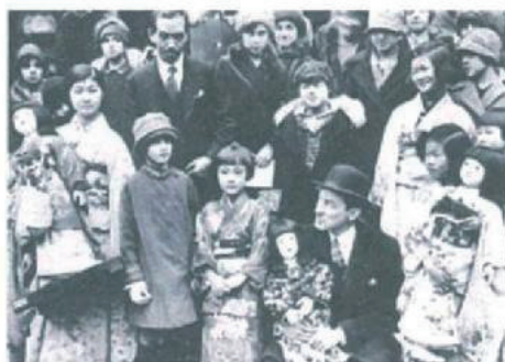
13 人形は、一年をかけアメリカ中を回った。 The dolls journeyed around all over America spending one year by land and sea.