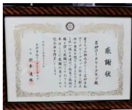
高砂青松RCからの感謝状