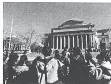
Jazz at Lincoln Centerにてワークショップ受講