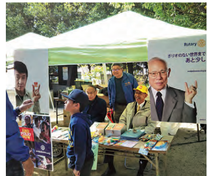
11月17日ラトローブ・デー 於：市ノ池公園

◎国際ロータリー第2680地区 青少年交換小委員長より 「青少年交歓学友会主催クリスマスパーティのご案内」が届いております。