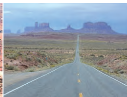
モニュメントバレー