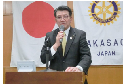
高砂市長 都倉達殊 様