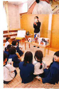
タブレット学習 (コベルコさんとコラボ)